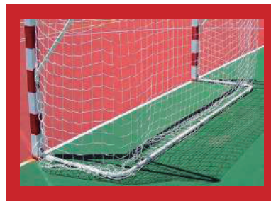
(1) Detalle de portería por detrás con base opcional