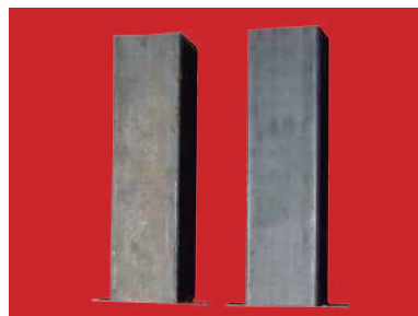
(2) Detalle de los botes